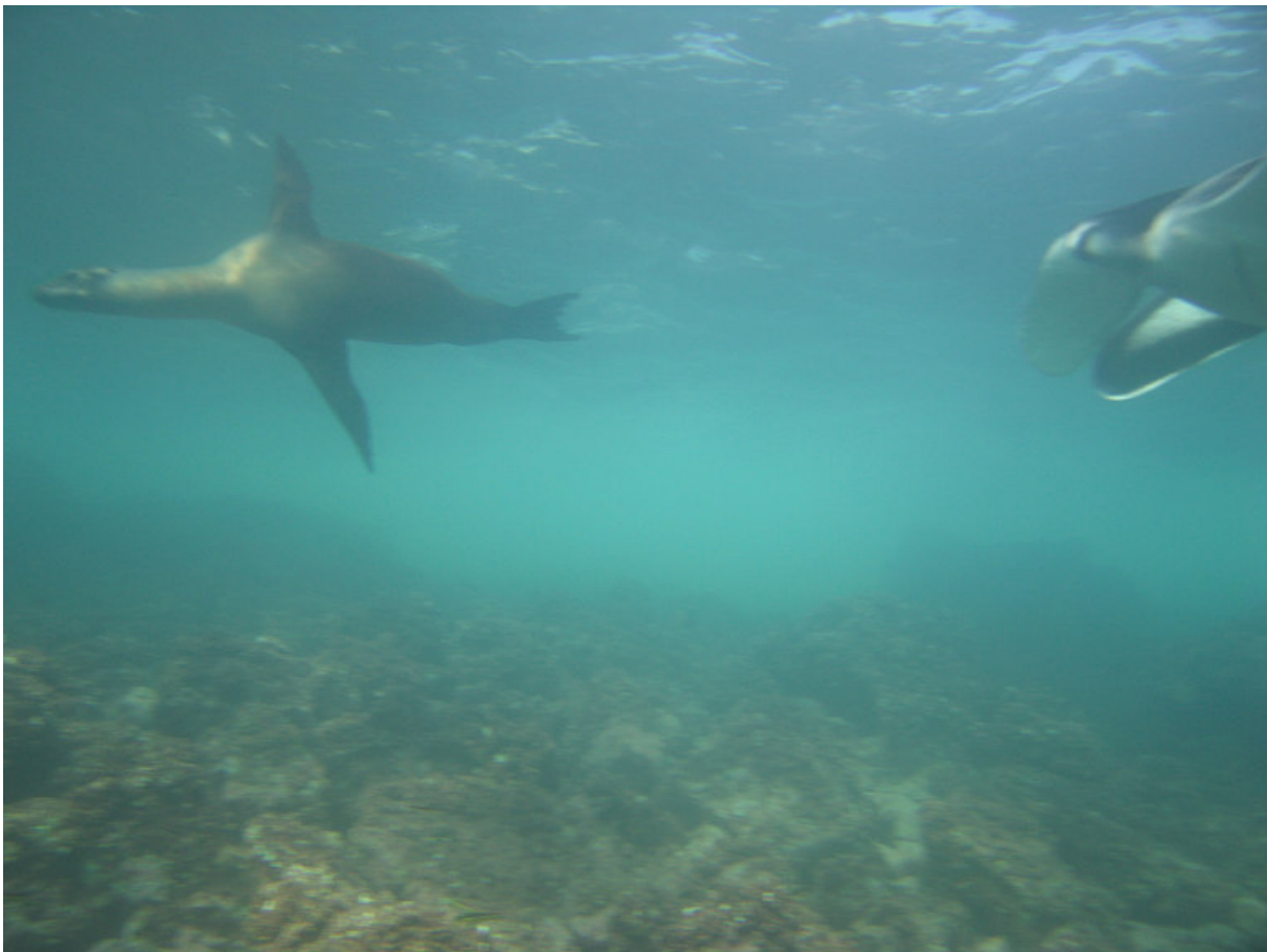
Showoff!!! Skarv?? Men hvor er Havbasserne?