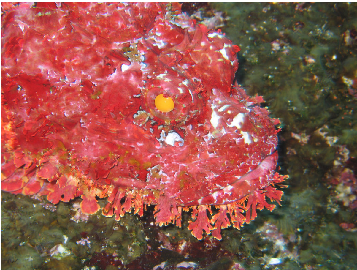
Panserulk i fuld ornat, men hvor er Havbasserne?

Der var en del måger der holdt mere af at svømme end flyve. Gud ved om det er tilladt for svenskerne at stække den lokale fuglebestand for at holde dem til Ven. Vi fandt ingen Havbasser ved kysten og bestemte os så for at dykke på nordsiden selvom der er en frygtelig masse muslinger. Her var mest læ.