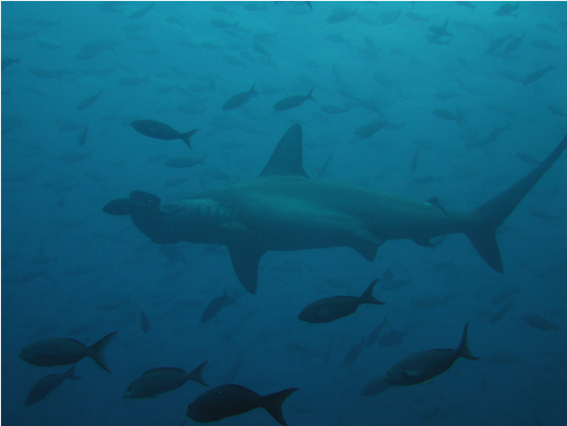
Kongeål, men hvor er Havbasseerne?