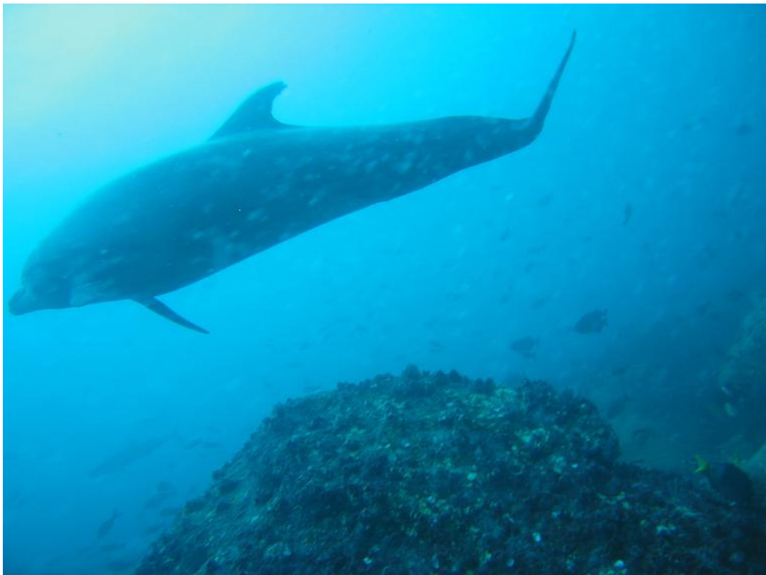
Ok marsvin, men hvor er Havbasseerne?